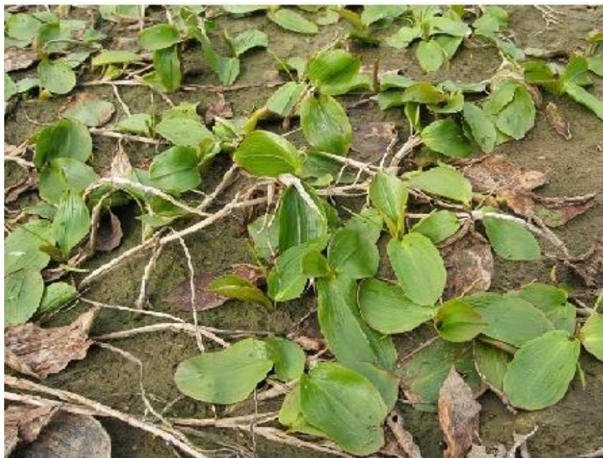
Рис 1. Фітоугруповання Potamogeton natans в умовах обміління русла Південного Бугу (околиця м. Вознесенська, лівий берег)

до пересихання) створюють критичні умови для існування типової водної рослинності, де часто рослини можуть знаходитися на суходолі (Рис. 1.). Відповідно, різноманітність останньої, у межах даних ділянок середніх та малих річок, є різко обмеженою (приблизно від 5 до 15 фітоцентичних одиниць). Також слід додати, що найбільше ценотичне багатство лучно-галофітної рослинності та справжня солончакова рослинність (содникові, солонцеві та полиново-содникові угруповання) зафіксовані серед плавневих біотопів Чичиклії, що пояснюється значним засоленням ґрунтів запливи водотоку ініціюючи галофітизацію травостою.