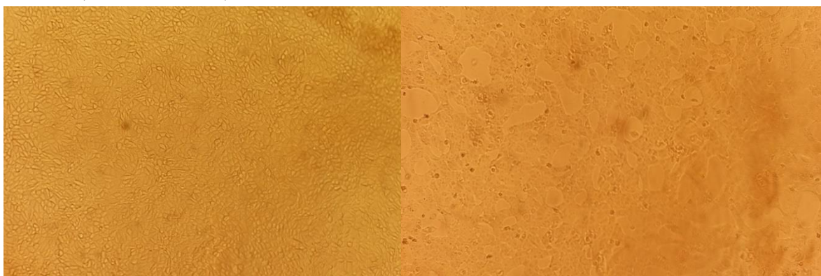
Рис. 3 та 4. Культура клітин MDBK, інфікована ПЛР-позитивним ізолятом BCoV. Контроль культури клітин – зліва. Культура клітин з ознаками ЦПД через 72 год після інфікування – справа.

Інші зразки від ПЛР-позитивних тварин не виявляли характерної ЦПД за перших 2х пасажів культивування в усіх досліджуваних культурах клітин.